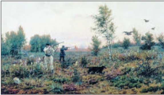
А. Д. Кившенко. По тетеревиным выводкам. Холст, масло. 1888 год