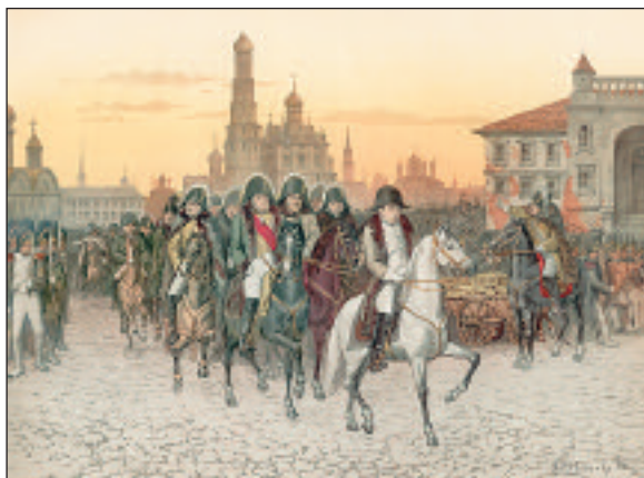
Наполеон, оставляя Москву, выезжает из Кремля. 1812 год