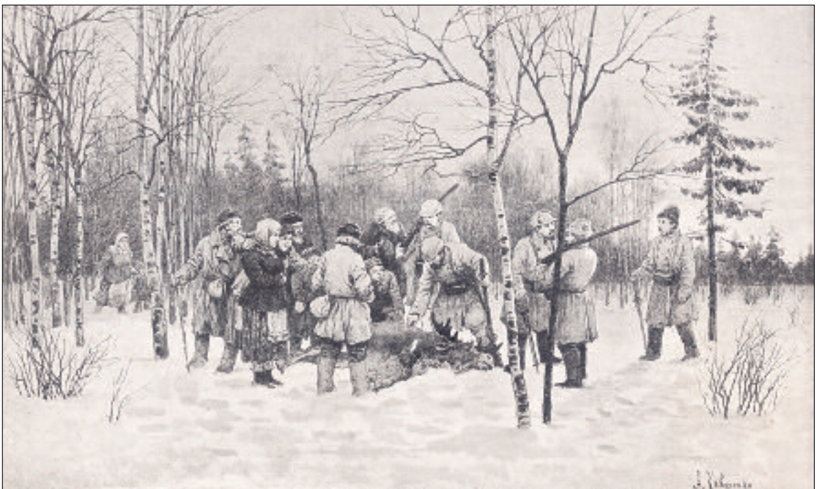
А. Д. Кившенко. Чей убитый лось? Холст, масло. Б. д.