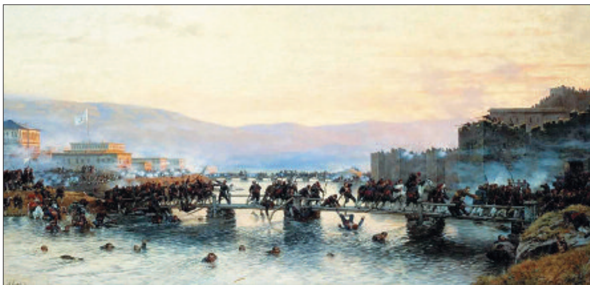
А. Д. Кившенко. Штурм крепости Ардаган 5 мая 1877 года. Холст, масло. 1886 год

В 1884 году Кившенко предпринял поездку в Закавказье и Азиатскую Турцию. Он делал этюды в Карсе, Ардагане, Ардануче и Горгохотане, на Аладжинской позиции. Акварельные эскизы будущих больших батальных картин на темы «Взятие штурмом укрепленных Горгохотанских высот 1 января 1878 года» и «Штурм крепости Ардаган 5 мая 1877 года» одобрил лично Александр III. Обе картины