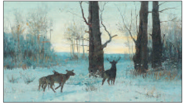
А. Д. Кившенко. Вечерний лес. Олени. Дерево, масло. Б. д.