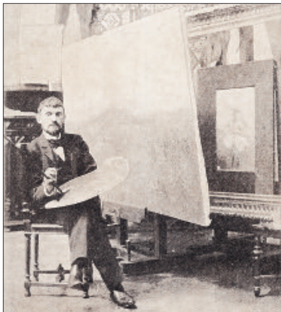
А. Д. Кившенко за работой в своей мастерской. Фотография конца XIX века

В возрасте 9 лет его отправили в Петербург, где мальчик начал заниматься в хоровой капелле и в рисовальной школе Общества поощрения художеств. Посещал рисовальные вечера И. Н. Крамского. В 1867 году поступил в Академию художеств в качестве вольноприходящего ученика и, поддавшись тогдашней моде на естественные науки, одновременно — в Технологический институт. Проучился в нем два года и бросил. Год был слушателем Медико-хирургической академии. Средства на жизнь зарабатывал «службой в Адмиралтействе, получая там в качестве писца 12 рублей в месяц жалованья» 5 .