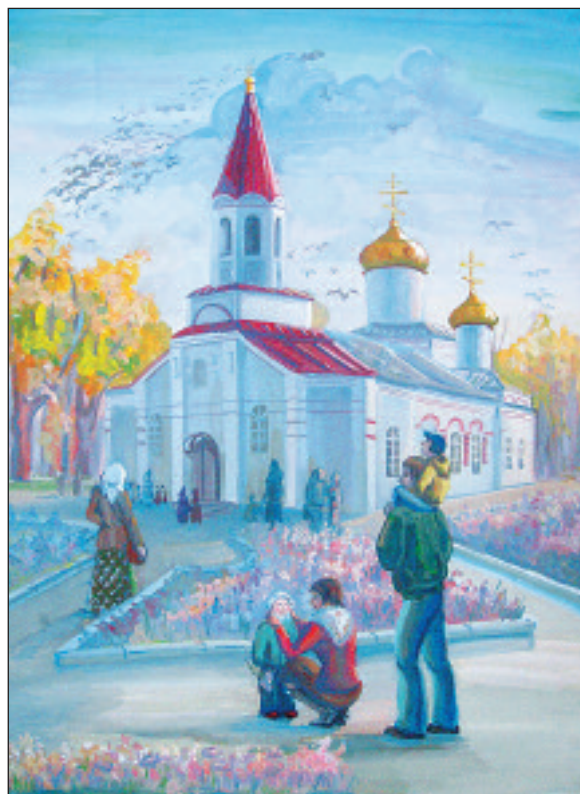
Рисунок Анастасии Одноваловой