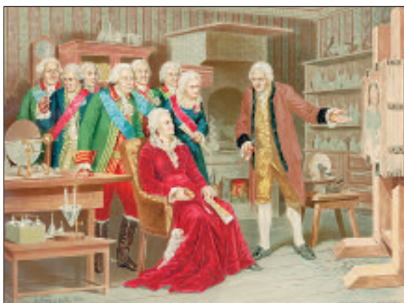
Екатерина II с княгиней Дашковой и другими вельможами в кабинете Ломоносова. 1764 год