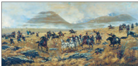
А. Д. Кившенко. Нижегородские драгуны, преследующие турок по дороге к Карсу во время Аладжинского сражения 30 октября 1877 года. Холст, масло. 1892 год

в Кане Галилейской» удостоилась большой золотой медали. Пенсии, правда, лауреат не получил, так как навлек на себя нарекания И. Н. Крамского: «Знают ли конкуренты на большую золотую медаль и особенно г. Кившенко, удостоенный этой медали, что-либо из истории искусства? Где он поместил своих пирующих на браке: в проходе ли нынешнего гостиного двора или в обстановке, возможной исторически?» 7