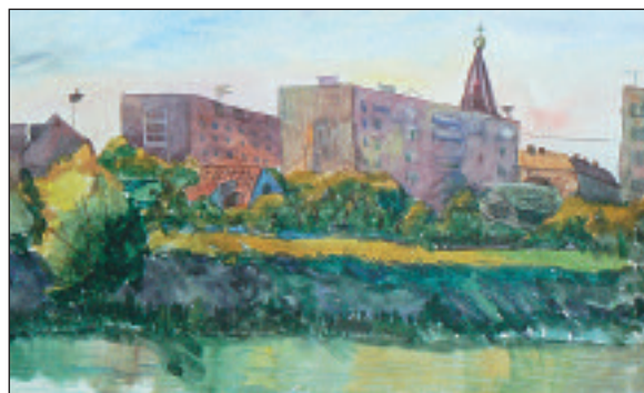
Рисунок Натальи Плотниковой