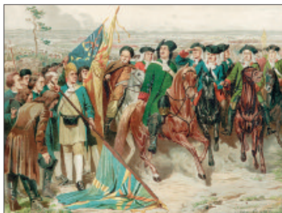
Полтавский бой: Шведы преклоняют знамена перед Петром I. 1709 год