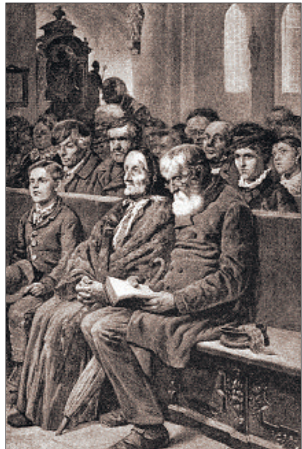
А. Д. Кившенко. В католической церкви. Холст, масло. 1883 год

В 1884 году за картину «Псарный двор» Алексей Данилович получил звание академика, в 1893-м удостоился избрания действительным членом императорской Академии художеств 15 и присвоения звания профессора (за картины «Чтение Высочайшей грамоты...» и «Нижегородские драгуны...»).