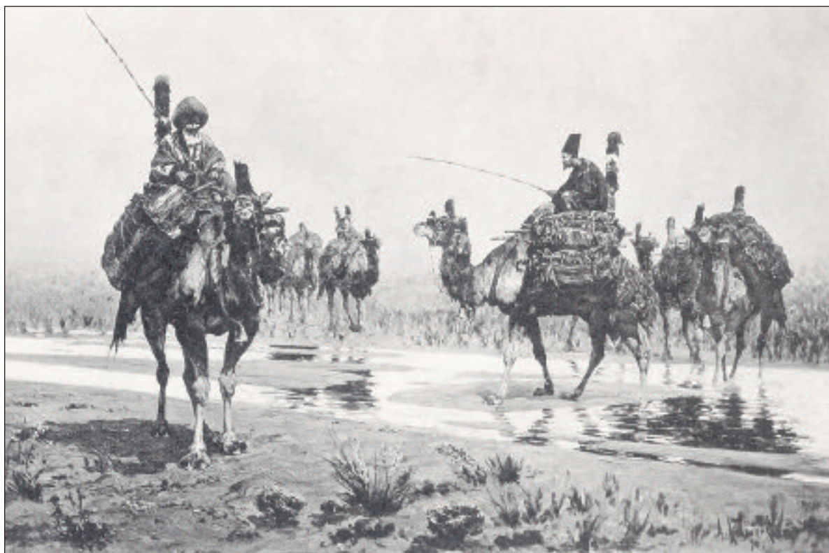
А. Д. Кившенко. В верховьях реки Тигр. Холст, масло. 1890 год

Ташкисен, Телиш, Горный Дубняк, Плевна, Шипка, Калофер, Филиппополь. Результат поездки — работы «Третий день боя на Шипкинском перевале 11 августа 1877 года» (1894), «Последний Шипкинский бой. Сражение при деревне Шейново и Шипке и взятие в плен всей шипкинской армии 28 декабря 1877 года» (1895), «Бой под Горным Дубняком 12 октября 1877 года» (1895, не окончена). По заказу графа Шереметева Кившенко написал «Нижегородских драгун, преследующих турок по дороге к Карсу» (1892). Помимо заказанных военной галереей, были созданы еще ряд больших полотен, в их числе — «Преследование казаками курда» (1885), «Курды-лазутчики» (1885), «В виду неприятеля» (1886).