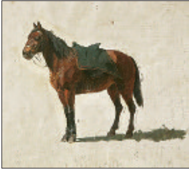
А. Д. Кившенко. Лошадь. Этюд. Холст, масло. Вторая половина XIX века. Из коллекции Тульского областного художественного музея