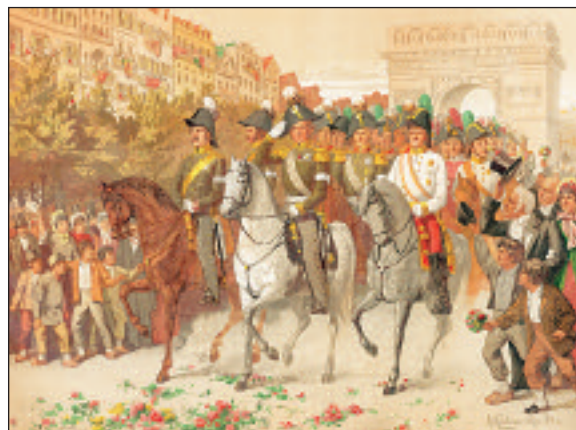
Торжественный въезд Александра I с союзниками в Париж. 1814 год