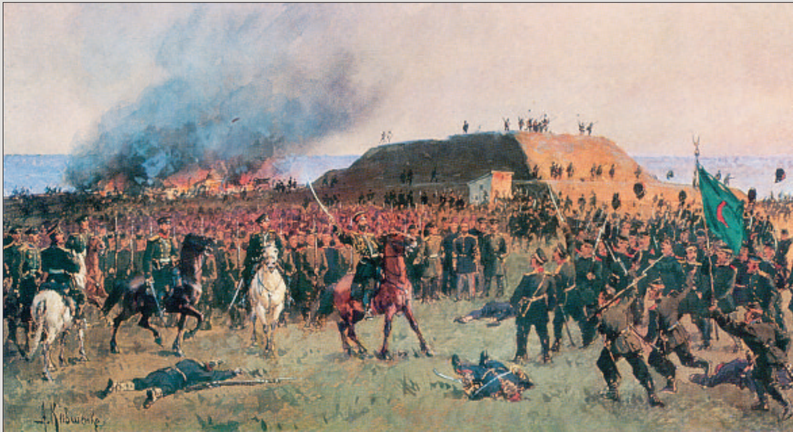
А. Д. Кившенко. Взятие Горного Дубняка в Болгарии . Холст, масло. 1878 год

Исследователи творчества художника, а также военные историки в один голос утверждали, что его работы на сюжеты русско-турецкой войны отмечены естественностью композиции, отсутствием нарочитых эффектов, типичностью образов, удачными пейзажными мотивами. Все это позволило искусствоведам отнести А. Д. Кившенко к новой школе «баталистов-эпиков» 10 .