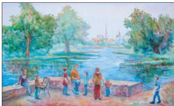
Рисунок Алены Кривенковой