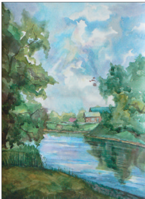
Рисунок Алены Кривенковой