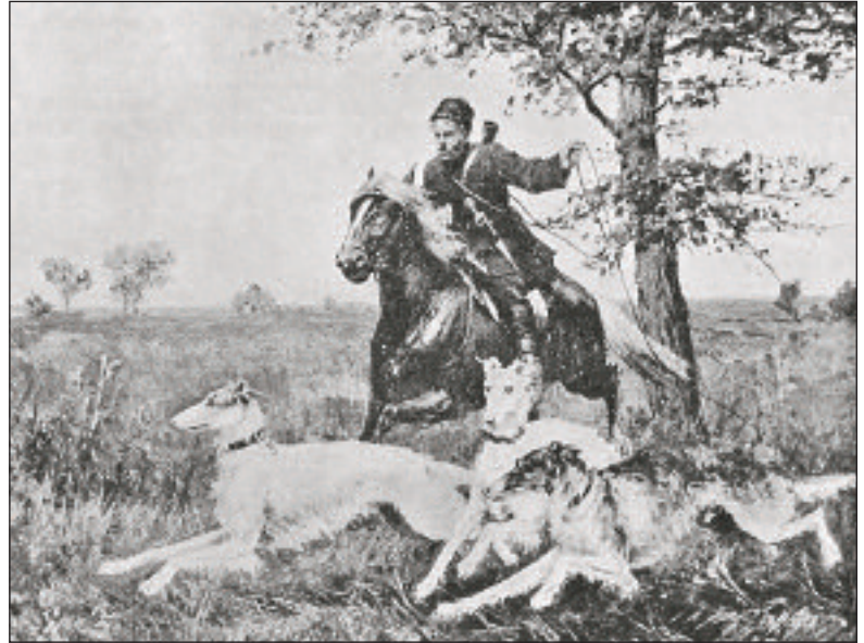
А. Д. Кившенко. С борзыми. Холст, масло. Б. д.