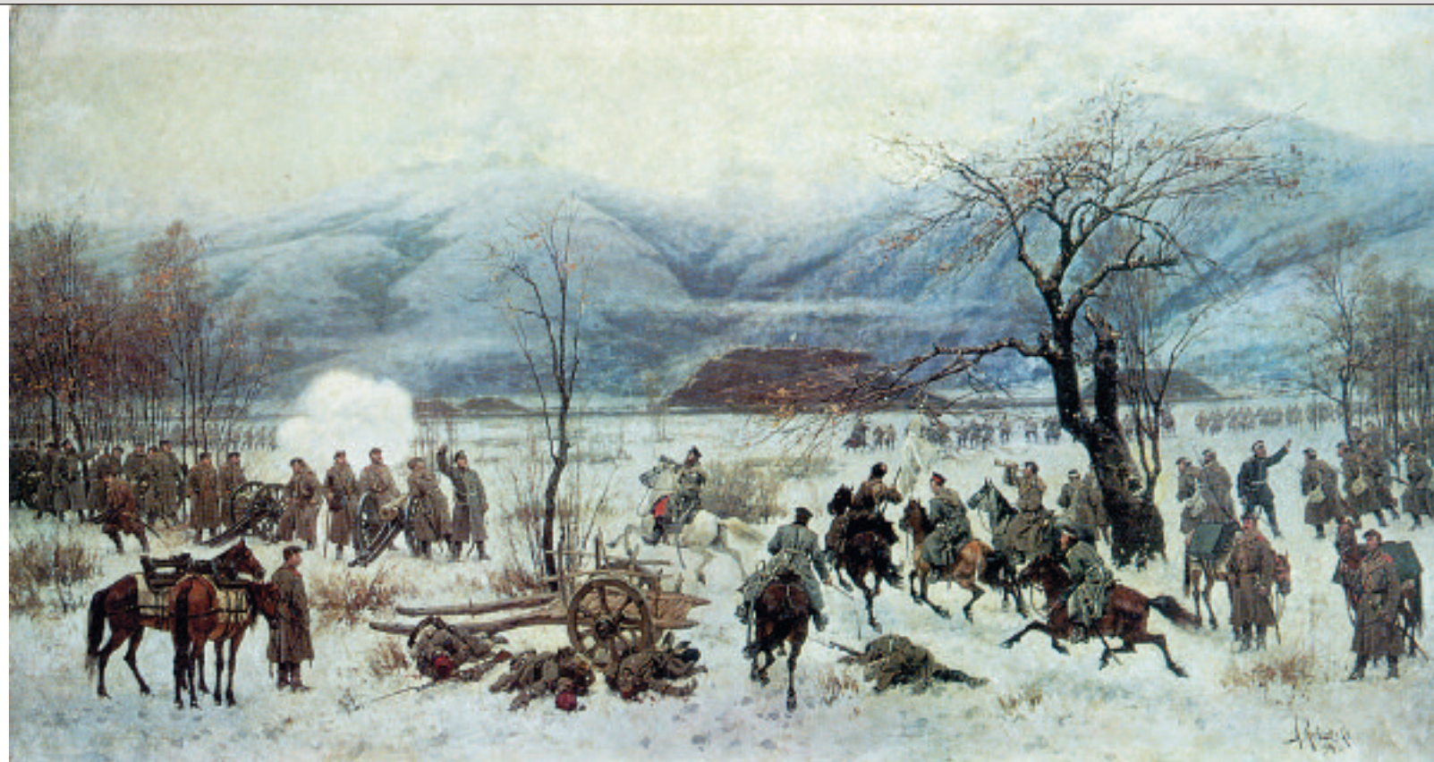
А. Д. Кившенко. Сражение у Шипки-Шейново 28 декабря 1877 года. 1894 год