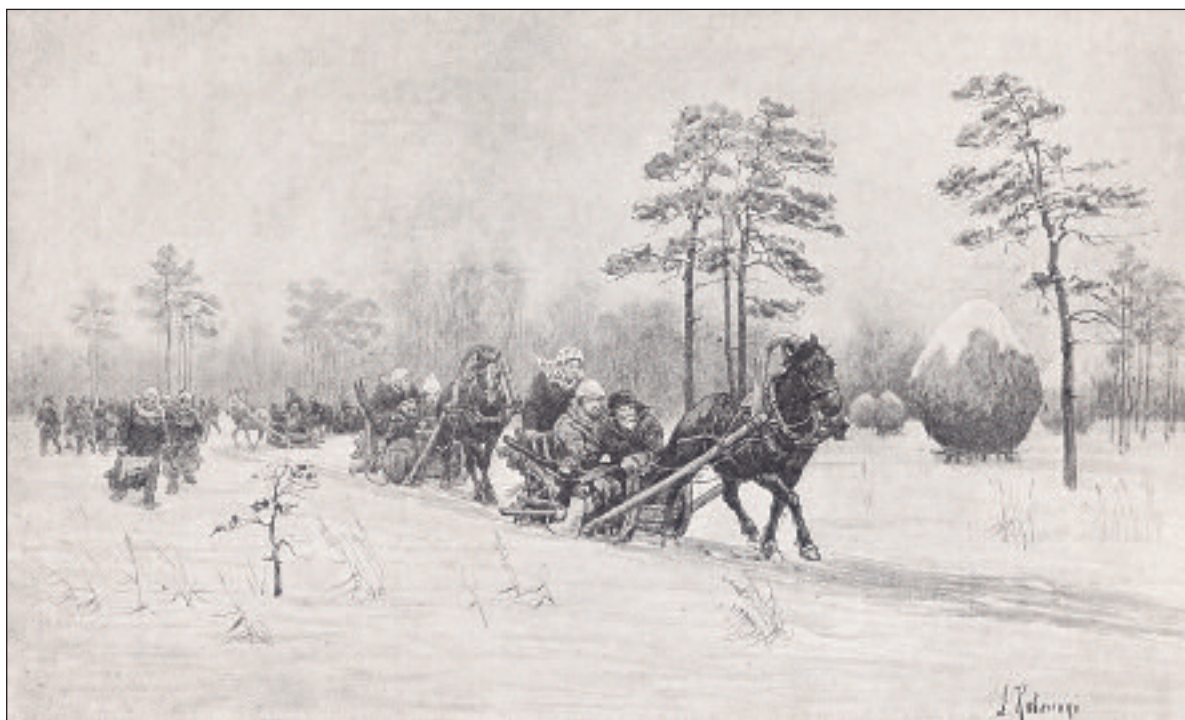
А. Д. Кившенко. Поездка на охоту. Холст, масло. 1885 год

АЛЕКСЕЙ ДАНИЛОВИЧ КИВШЕНКО ДОВОЛЬНО ЧАСТО ПРИЕЗЖАЛ НАВЕСТИТЬ ОТЧИЙ ДОМ И ПОГОСТИТЬ В ИМЕНИИ ЧЕРТКОВЫХ В ВОРОНЕЖСКОЙ ГУБЕРНИИ. ИМЕННО ТАМ ОН, УВЛЕКШИСЬ ОХОТОЙ, НАЧАЛ ПИСАТЬ СЦЕНЫ ОХОТНИЧЬЕЙ ЖИЗНИ.