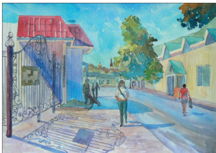
Рисунок Марии Жиляевой