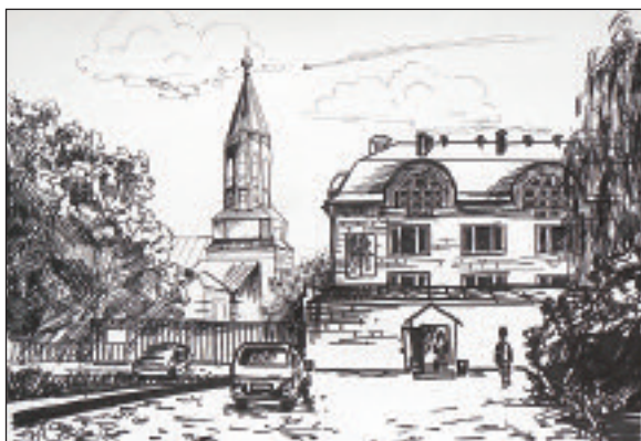
Рисунки Анастасии Прокопчук