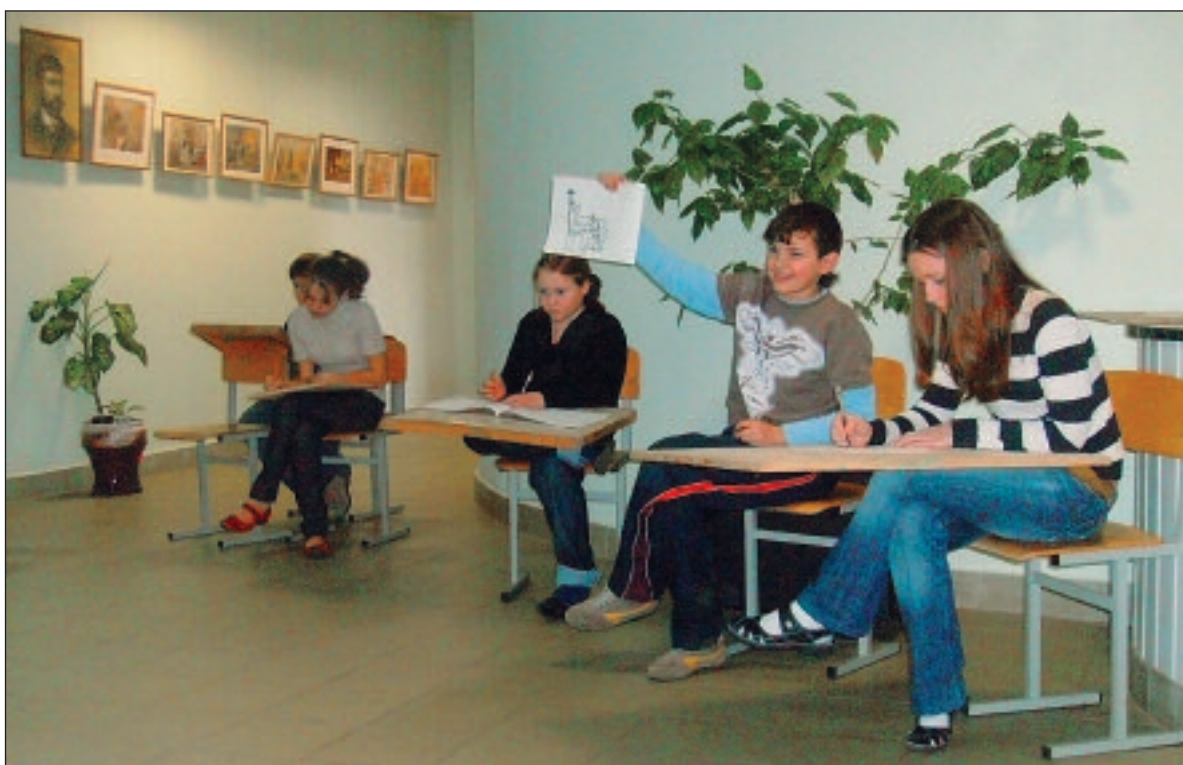
На занятиях. Фотография 2007 года