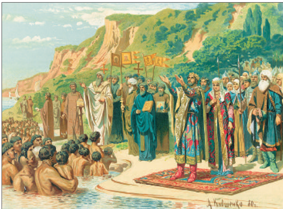
Крещение киевлян Владимиром Святым. 988 год