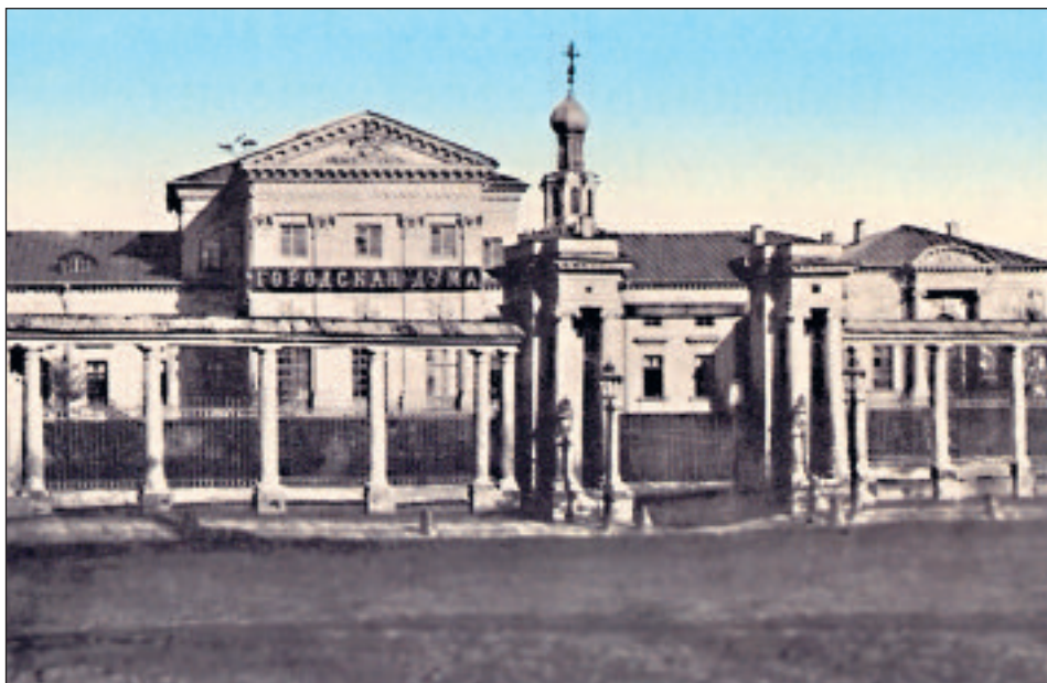
Дом графа К. Г. Разумовского на улице Воздвиженка, 6 (ныне — Романов переулок, 2), где Московская городская дума работала с 1863 по 1892 год. Фотография 1880-х годов

20 марта 1862 года император Александр II утвердил представленное москвичами «Положение об общественном управлении города Москвы», закреплявшее новые принципы проведения выборов, организации и функционирования этого социального института. С принятием Положения ситуация в Москве коренным образом изменилась, поскольку теперь значительная часть властных и управленческих функций передавалась общественному городскому управлению. Тем самым появились реальные предпосылки для модер-