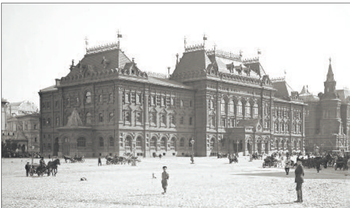
Здание Московской городской думы на Воскресенской площади. Здесь Дума работала с 1893 по 1917 год. Фотография П. П. и Е. П. Павловых конца XIX—начала XX века из собрания Центрального архива электронных и аудиовизуальных документов Москвы. 4-989

11 июня 1892 года императором Александром III утверждается новый Закон о Городовом положении, согласно которому в очередной раз был реорганизован порядок выборов: впервые образовывалась система территориальных избирательных округов, вводился личный имущественный ценз, основанный на владении недвижимостью. Структура органов городского самоуправления не изменилась, в Городскую думу на четыре года выбирались 160 гласных. Городской голова состоял