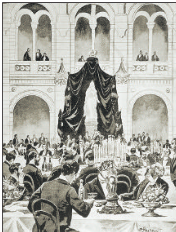
Рисунок С. Мухарского из архива ЦИГУС

ского головы была учреждена должность председателя Думы. Среди двухсот думских гласных большинство (58%) составили представители партии эсеров.